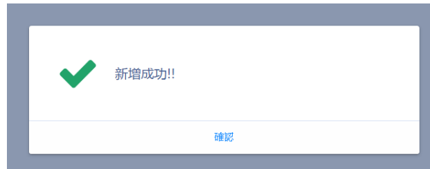
圖 2.2-2 訊息畫面